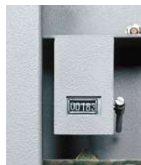
Le compteur et le scellé du foncet (en option): de précieux indices pour savoir si l'armoire a été ouverte en votre absence.