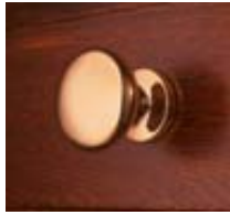
Laiton chromé brossé Laiton verni